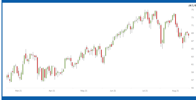
紐約 9 月期油日線走勢圖