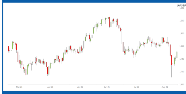
紐約 12 月期金日線走勢圖