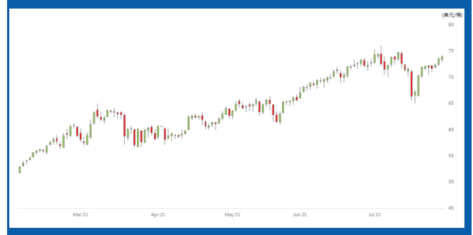
紐約 9 月期油日線走勢圖