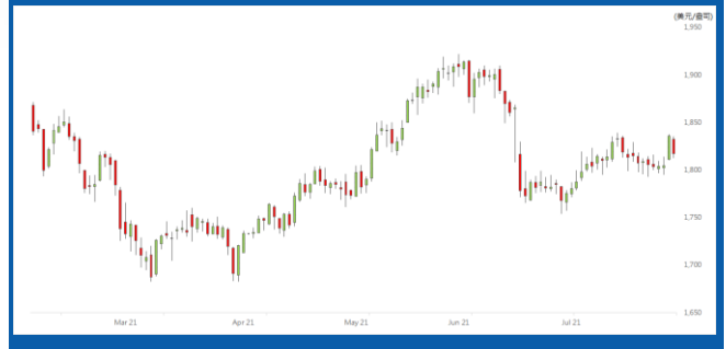
紐約 12 月期金日線走勢圖