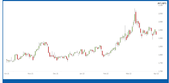
紐約 6 月期金日線走勢圖