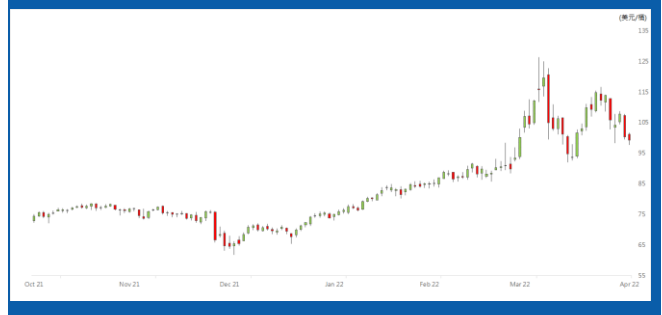
紐約 5 月期油日線走勢圖