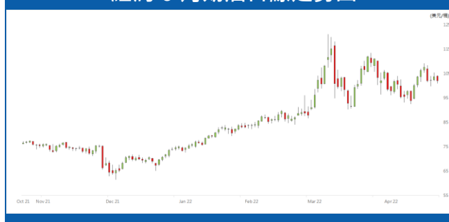
紐約 6 月期油日線走勢圖