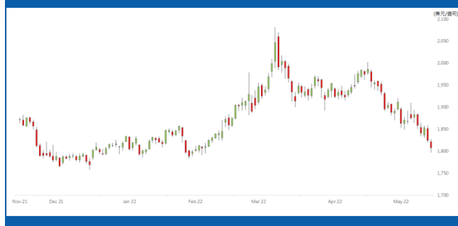
紐約 6 月期金日線走勢圖