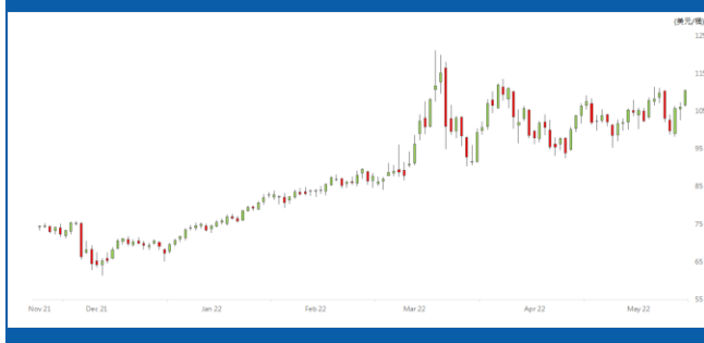
紐約 6 月期油日線走勢圖