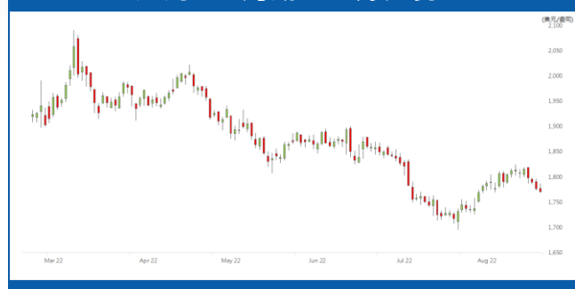
紐約 12 月期金日線走勢圖