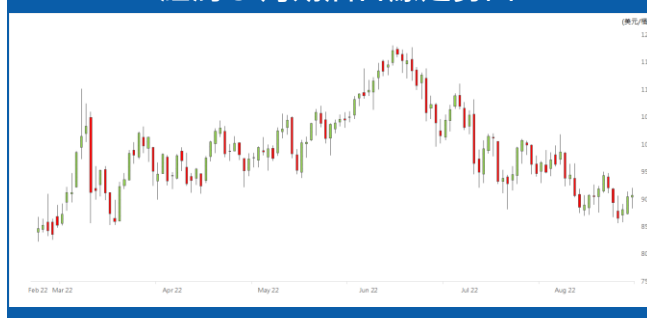
紐約 9 月期油日線走勢圖