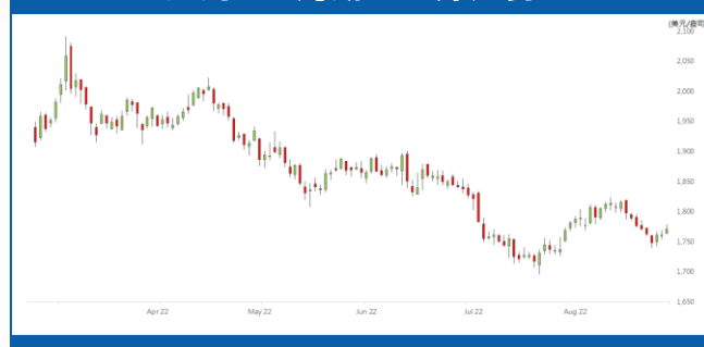
紐約 12 月期金日線走勢圖