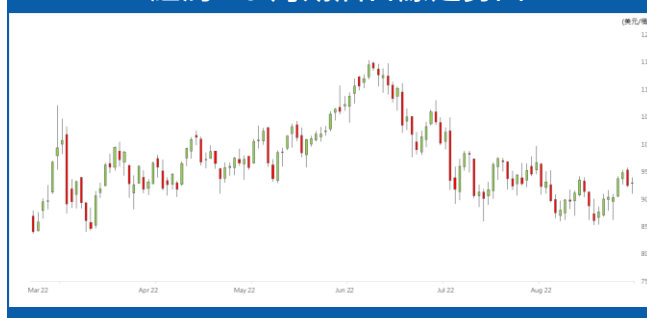
紐約 10 月期油日線走勢圖