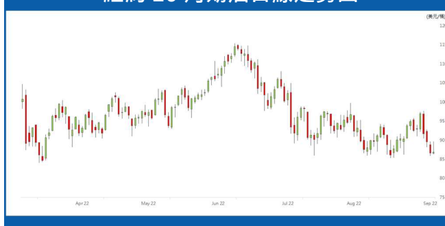
紐約 10 月期油日線走勢圖