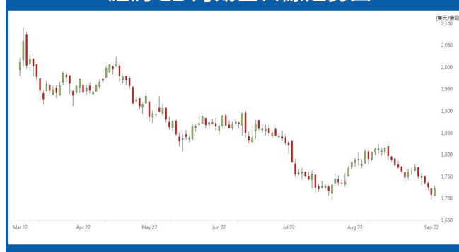
紐約 12 月期金日線走勢圖