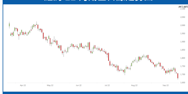
紐約 12 月期金日線走勢圖