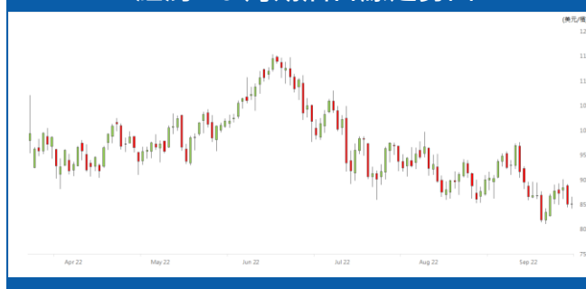
紐約 10 月期油日線走勢圖